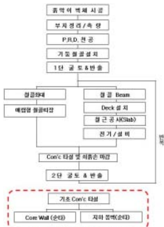
그림 2. CWS공법 시공순서 플로우 차트