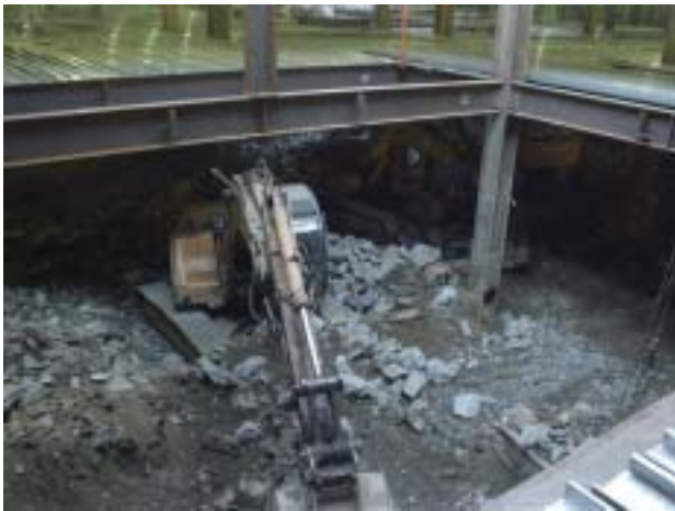
그림 6. 굴토 및 철골보 설치