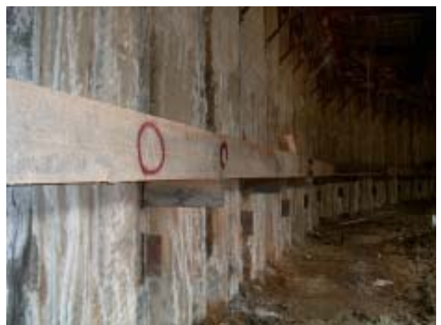
그림 4. 철골띠장 설치.