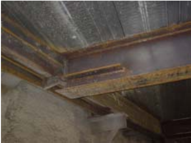
그림 5. 철골띠장과 보부재 접합