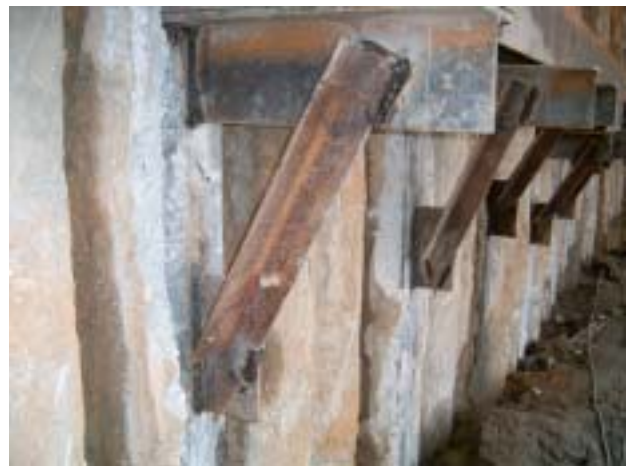
그림 3. 철골 좌대 설치

* 테두리보 부분의 공사비만을 산정한 값이며, 현장의 견적결과임. 공기 단축에 따른 공사비 절감효과는 고려하지 않았음.